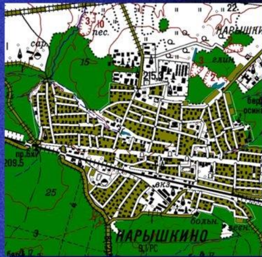
Масштаб 1 : 50 000

Для создания (обновления) цифровых топографических карт и планов городов в ГИС "НЕВА" используются расчлененные издательские оригиналы и тиражные оттиски топографических карт и планов городов, а также цифровая картографическая продукция, материалы современной аэрофотосъемки и космические снимки.